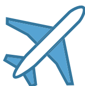
Letecká nákladní doprava